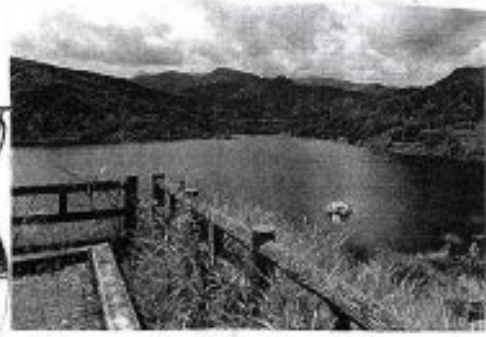
大谷ダム ② 1枚毎に干ヤムが鳴ります。